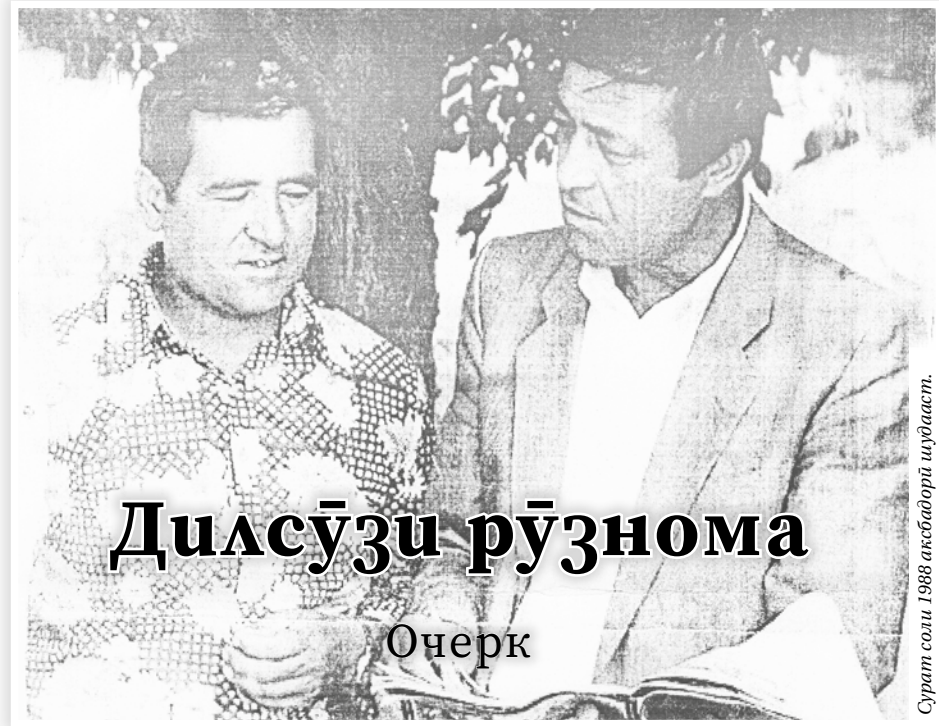
Дилсўзи рўзнома Очерк